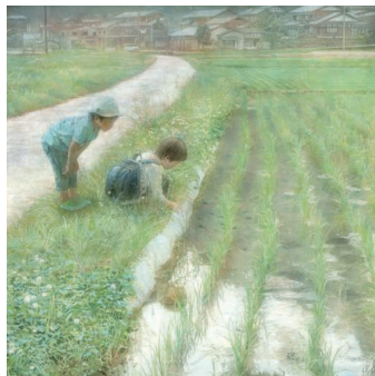
芝康弘《六月の詩》2011年 東京オペラシティ アートギャラリー蔵 SHIBA Yasuhiro, Poem of June , 2011, Tokyo Opera City Art Gallery

作家の内諾が取れて出品リストの大筋が固まったら、次に輸送と展示の準備に入ります。出