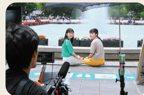
2023年上野公園 Ueno Park in 2023

差することで、各文化施設の魅力がより広がる動画とすることができました。それぞれの年代での楽しみ方が、この動画をみる方に伝われば幸いです。(東京都美術館 学芸員 河野佑美)