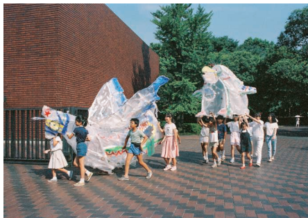
夏休み子供アトリエ「不思議の国の動物図鑑」 1987年撮影

Children's Summer Vacation Atelier "Animal Picture Book in Wonderland," 1987 photo