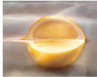
近藤オリガ《月下のレモン》2022年 個人蔵 KONDO Olga, Lemon Under the Moon , 2022, private collection

品される絵画の所在は各作家のアトリエとは限りません。個人所蔵者の家や倉庫、ギャラリー、美術館など、全国各地さまざまな場所に保管されていますので、それぞれの所蔵者と借用交渉を行い、集荷、展示、撤去（バラシ）、返納の予定を組む必要があります。舞台用語で「仕込み」とは、大道具や照明の装置を組むことですが、展覧会の場合はその前に美術品を借り集めることが大仕事なのです。出品作品は、芝居であり、役者そのものでもあります。