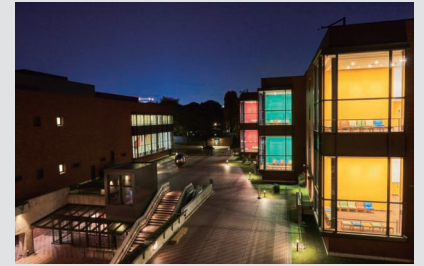
東京都美術館 外観 中央棟側から撮影（正門正面 右手公募棟 手前より第2,3,4棟）

Tokyo Metropolitan Art Museum, exterior view from the Central Wing (Citizen's Gallery Wing on the right; Galleries 2, 3, 4 from foreground back)