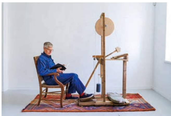
ダンヒル & オブライエン 《装置：ムーアの木槌 V1》 2024年

本展ではDIYを「目の前の問題を自らの工夫で解決するアプローチ」と捉えます。DIYの考え方や手法を参照点とし、7組の出品作家の作品を通じて、「よりよく生きる」ための素朴な思いから生まれる創造性に注目しています。出品作家の多くは必ずしも作品をDIYと明言している