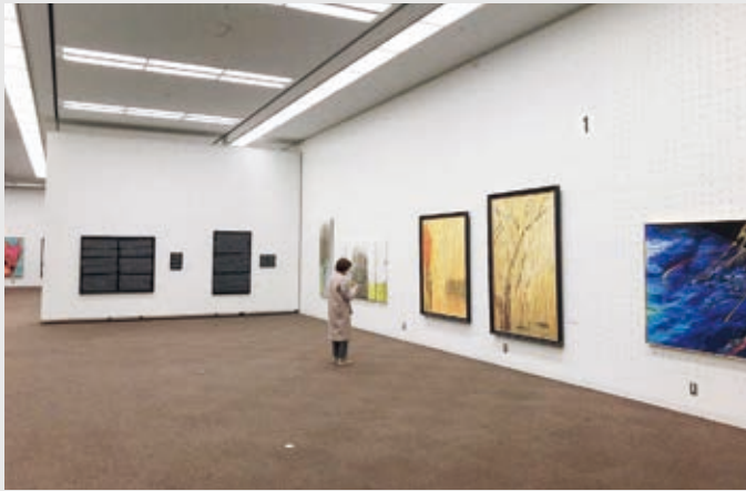
公募展示室の展示風景（行動美術協会「第16回 行動美術TOKYO展」 2025年3月） Public Entry Exhibition, gallery view ("KOHDO BIJUTSU TOKYO ART EXHIBITION," KOHDO BIJUTSU ASSOCIATION, Mar. 2025)

「推し」の作家、 公募展を見つけよう！ "Discover your oshi ('fave') artist or art group!"