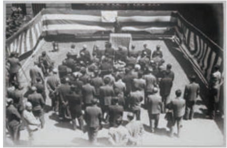
開館20周年記念式典風景 1947年撮影

The Tokyo Metropolitan Art Museum's 20th anniversary ceremony. Photo dated 1947