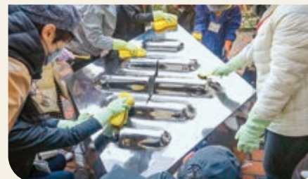
野外彫刻洗浄の様子 Scene of washing an outdoor sculpture 五十嵐晴夫《メビウスの立方体》1978年 井上武吉《Plus and Minus No.55》1975年

東京都美術館の野外彫刻マップ https://www.tobikan.jp/archives/collection.html