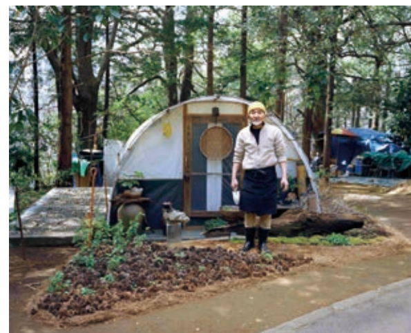
野口健吾《庵の人々 東京都渋谷区》 2011年 ラムダプリント

Dunhill and O'Brien, Apparatus: Moore's Mallet V1, 2024